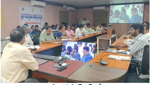
కాకినాడ (సిటిజన్ టైమ్స్) మే 8

అధికారుల నిర్లక్ష్యాన్ని ఉపేక్షించం : కమిషనర్ -ఎన్టీపీ సత్యనారాయణ