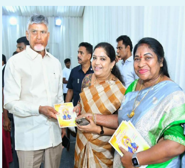
అల్లూరి జిల్లా, సిటిజన్ టైమ్స్, మే :08

గిరిజనుల ఆరాధ్య దైవంగా వెలుగొందుతున్న పాడేరు మోదకొండమ్మ అమ్మవారి వార్షిక ఉత్సవాలకు ముఖ్యమంత్రి నారా చంద్రబాబు నాయుడును రాష్ట్ర గిరిజన సంక్షేమ, మహిళా శిశు సంక్షేమ శాఖ మంత్రి గుమ్మడి నంద్యారాణి, ఉత్సవ కమిటీ చైర్మన్, పాడేరు మాజీ ఎమ్మెల్యే గిడ్డి ఈశ్వరి మర్యాదపూర్వకంగా ఆహ్వానించారు. ఈ మేరకు వారు సీఎంను కలిసి ఉత్సవాల ఆహ్వాన పత్రానికను అందజేశారు. అమ్మవారి ఉత్సవాలు గిరిజన సంప్రదాయాలు, ఆధ్యాత్మిక విశ్వాసాలకు ప్రతీకగా ఎంతో వైభవంగా నిర్వహించబడతాయని వారు సీఎంకు వివరించారు. ఉత్సవాలకు హాజరై అమ్మవారి ఆశీస్సులు పొందాలని కోరగా, కార్యక్రమానికి హాజరయ్యేందుకు ప్రయత్నిస్తానని చంద్రబాబు నాయుడు తెలిపారు.