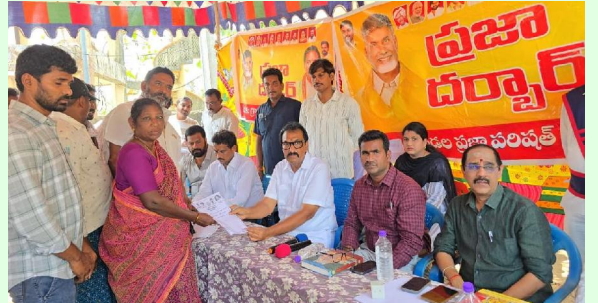
అత్రేయపురి సిటిజన్ టైమ్స్ మే 8