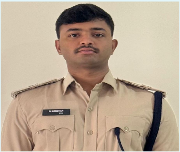
అనకాపల్లి, సిటిజన్ టైమ్స్, మే :08