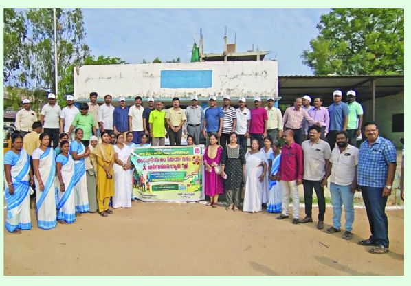
సిటిజన్ టైమ్స్ నాగర్ కర్నూల్ మే 8