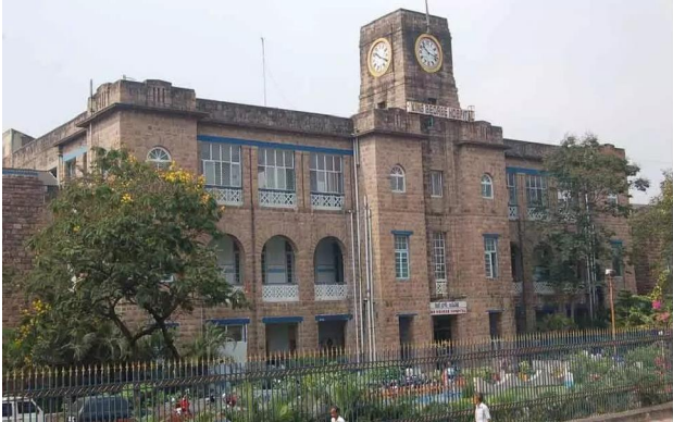
విశాఖపట్నం, సిటిజన్ టైమ్స్, మే :08