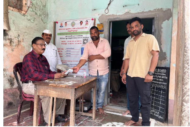
అమలాపురం సిటిజన్ టైమ్స్ మే 8