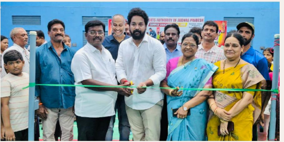
అమలాపురం సిటిజన్ టైమ్స్ జిల్లా బ్యూరో