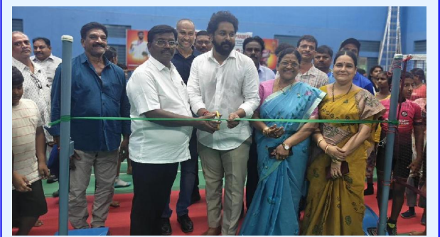
అమలాపురం సిటిజన్ టైమ్స్ మే 8