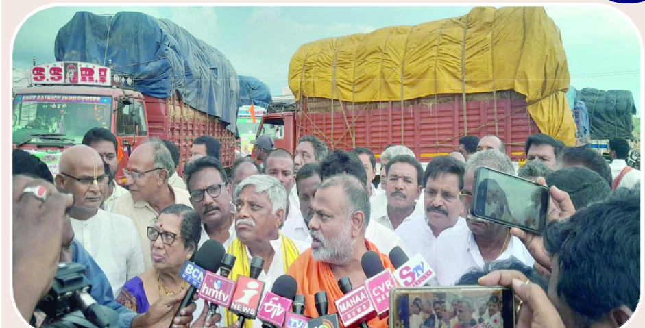
కాకినాడ (సిటిజన్ టైమ్స్) మే 8