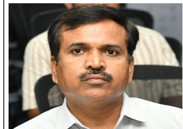
విశాఖపట్నం, సిటిజన్ టైమ్స్, మే 08

మహా విశాఖపట్నం నగర పాలక సంస్థ తూర్పు జోన్ పరిధిలో ఖాళీగా వున్న షాపు రూములు, కళ్యాణ మండపములకు, 3 సంవత్సర ముల కాలమునకు గుత్తలకు ఇచ్చుటకు గాను తేదీ: 14-05-2026 న ఉదయం 11 గంటలకు తూర్పు జోన్లో కార్యాలయంలో బహిరంగ వేలం నిర్వహించబడునని, ఆసక్తి గల పాలదారులు పూర్తి వివరాలకు జోన్లో కమిషనర్ కార్యాలయం లోని పని వేళల్లో కార్యాలయ పర్యవేక్షకులను సంప్రదించగలరని, జోన్లో కమిషనర్ కె.శివప్రసాద్ శుక్రవారం పత్రికా ప్రకటన ద్వారా తెలియజేశారు.