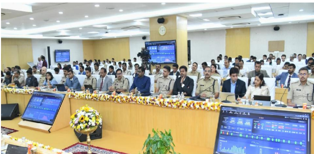
అమలాపురం /అమరావతి సిటిజన్ టైమ్స్ మే 8

నేరాల కట్టడి, రోడ్ల ప్రమాదాలు, సైబర్ నేరాలు వంటి అంశాలపై చర్చ.. గతేడాదితో పోల్చుకుంటే క్రైమ్ రేట్ తగ్గిందని సమావేశంలో ప్రజెంట్ చేసిన డిజిపీ హరీష్ కుమార్ గుప్తా. మహిళలపై నేరాలు 7%, చోరీలు 8%, అర్ధిక నేరాలు 0.3%, ఎస్సీ, ఎస్సీలపై నేరాలు 30% తగ్గయిన వెల్లడించిన డిజిపీ... సైబర్ నేరాల్లో మొత్తం రూ. 652 కోట్లు బాధితులు కోల్పోయారని.. వీటిల్లో రూ. 116 కోట్లు ఫ్రీజ్ చేయగలిగామన్న డిజిపీ. అర్ధిక నేరాలను కట్టడి చేసే విషయంలో మరింత యాక్టివ్ గా పని చేయాలని సీఎం నూనచ... సైబర్, అర్ధిక నేరాలను కట్టడి చేసేలా ప్రజల్లో మరింత అవగాహన కల్పించాలన్న ముఖ్యమంత్రి... రోడ్ల ప్రమాదాల నివారణకు మరింతగా ఫోకస్ తో పనిచేయాలన్న సీఎం చంద్రబాబు. కన్నీక్షన్ రేట్ 2025లో 44 శాతంగా ఉంటే... 2026లో 49.8 శాతానికి పెరిగిందని వివరించిన డిజిపీ... దీన్ని 70 శాతానికి తీసుకువెళ్లాలనే లక్ష్యాన్ని నిర్దేశించిన సీఎం చంద్రబాబు ఇన్ విజిబుల్ పోలీస్... విజిబుల్ పోలీసింగ్ అనేది చేసి చూపించాలన్న ముఖ్యమంత్రి పోలీసుల చర్యలు చూసి నేరం చేయాలంటే భయపడే పరిస్థితి రావాలన్న సీఎం ఈ సందర్భంగా