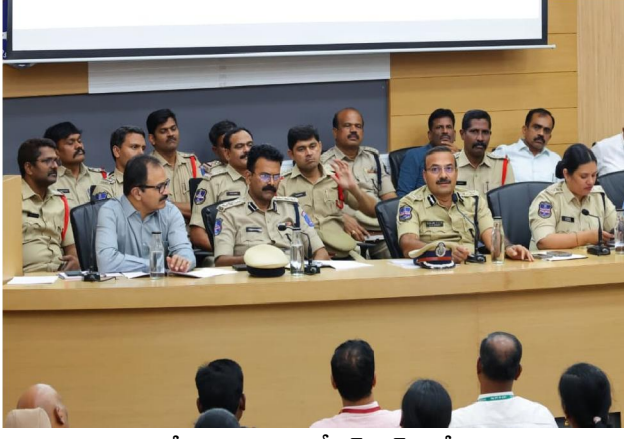
శేరిలింగంపల్లి, సిటిజన్ టైమ్స్, మే 8

సైబర్ నేరాలను అరికట్టడంలో సునిధితులను పట్టుకోవడంలో బ్యాంకుల సహకారం అత్యంత కీలకమని సైబరాబాద్ పోలీస్ కమిషనర్ డా. ఎం. రమేష్ స్పష్టం చేశారు. మ్యూల్ ఆకాంట్లు (ఇతరుల పేరుతో ఉండే ఖాతాలు) నియంత్రణ, దర్యాప్తులో సమన్వయంపై చర్చించేందుకు కమిషనరేట్ కార్యాలయంలో వివిధ బ్యాంకుల ప్రతినిధులతో ఆయన ప్రత్యేక సమావేశం నిర్వహించారు. సైబరాబాద్ పరిధిలో 2025లో రూ. 438 కోట్లు, 2026లో ఇప్పటివరకు రూ. 104 కోట్లు ప్రజలు కోల్పోయారని సీపీ ఆవేదన వ్యక్తం చేశారు. ఆన్లైన్ స్కామ్లు, సకీటీ పెట్టుబడి పథకాల వల్ల ప్రజలు అప్రమత్తంగా ఉండాలని కోరారు. బ్యాంకులకు కీలక సూచనలు ప్రతి బ్యాంకులో ప్రత్యేక సైబర్ సెల్ మరియు సైబర్ క్రిమి రెసెన్స్ డెస్క్ ఏర్పాటు చేయాలని సూచించారు.