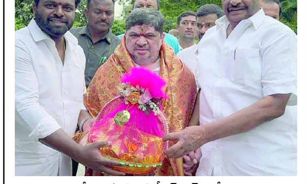
శేరిలింగంపల్లి, సిటిజన్ టైమ్స్, మే 08