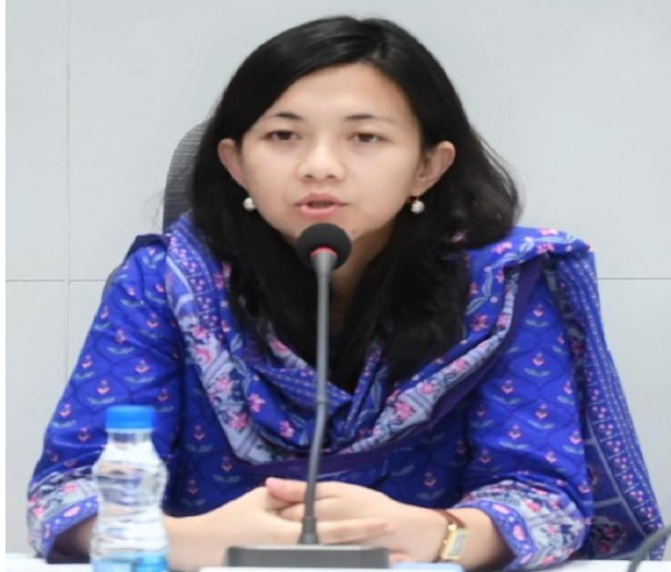
అమలాపురం, సిటిజన్ టైమ్స్ మే 08