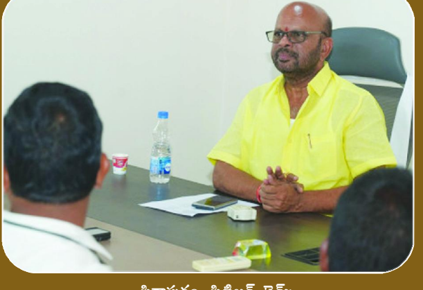
పిఠాపురం, సిటిజన్ టైమ్స్ 2024 ఎన్నికల తర్వాత పిఠాపురం నియోజకవర్గంలో తరచుగా వివాదాలు నెలకొంటుండడంపై టీడీపీ తరువాయి 2లో..