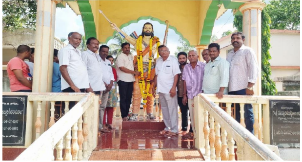
అల్లూరి సీతారామరాజు వర్ధంతి