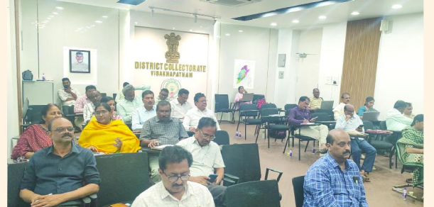
విశాఖపట్నం, సిటిజన్ టైమ్స్, మే :07

రాష్ట్ర సచివాలయం ఐదో ట్యాంక్ లోని కాన్ఫరెన్స్ హాల్లో ముఖ్యమంత్రి ఎన్. చంద్రబాబు నాయుడు నేతృత్వంలో గురువారం నిర్వహించిన 7వ కలెక్టర్ కాన్ఫరెన్స్ తొలి రోజు సమావేశంలో విశాఖపట్నం జిల్లా అధికారులు పాల్గొన్నారు. కలెక్టర్ టి. వీడియో కాన్ఫరెన్స్ హాల్ నుంచి వచ్చువల్ల విధానంలో సమావేశానికి హాజరైన అధికారులు, ఆయా శాఖలకు సంబంధించిన అంశాలను సమోదా చేసుకున్నారు. రాష్ట్ర అభివృద్ధి, ప్రజా సేవల మెరుగుదల, ప్రభుత్వ సంక్షేమ పథకాల సమర్థ అమలు, పరిపాలనలో పారదర్శకత, గ్రామస్థాయి సమస్యల పరిష్కారం, రెవెన్యూ పనులను సంక్షేమ కార్యక్రమాల పురోగతి తదితర అంశాలపై సమావేశంలో సమగ్రంగా చర్చ జరిగింది. అలాగే ప్రజలకు వేగవంతమైన సేవలందించడం, ప్రభుత్వ కార్యక్రమాల అమలులో సమన్వయం పెంపు, గ్రామస్థాయిలో సమస్యలను త్వరితగతిన పరిష్కరించే చర్యలపై ముఖ్యమంత్రి అధికారులకు పలు సూచనలు చేసినట్లు అధికారులు తెలిపారు.