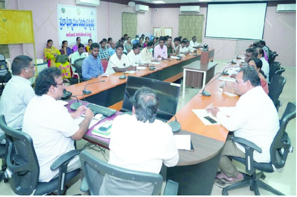
కాకినాడ (సిటిజన్ టైమ్స్) మే7