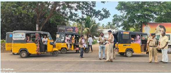
అసకాపల్లి, సిబిజెన్ టైమ్స్, మే 07

అసకాపల్లి జిల్లా ఎస్పీ తుహిన సిన్హా ఆదేశాల మేరకు జిల్లాలో చట్టవిరుద్ధ కార్యకలాపాలను అరికట్టేందుకు పోలీసులు అప్రమత్తంగా వ్యవహరిస్తున్నారు. ఇందులో భాగంగా జిల్లా వ్యాప్తంగా ముఖ్య కూడళ్లు, జాతీయ రహదారులు, పట్టణాలు మరియు గ్రామీణ ప్రాంతాల్లో ప్రత్యేక వాహన తనిఖీలు నిర్వహిస్తున్నారు. ఈ తనిఖీలలో అనుమానాస్పద వాహనాలు, నిబంధనలు ఉల్లంఘిస్తున్న వాహనదారులను పరిశీలిస్తూ అక్రమ రవాణా, మద్యం, గంజాయి మరియు ఇతర చట్టవిరుద్ధ కార్యకలాపాలపై కట్టుదిట్టమైన నిఘా కొనసాగిస్తున్నారు. ప్రజల భద్రత, శాంతిభద్రతల పరిరక్షణ లక్ష్యంగా పోలీసులు నిరంతరం అప్రమత్తంగా విధులు నిర్వహిస్తున్నట్లు అధికారులు తెలిపారు.