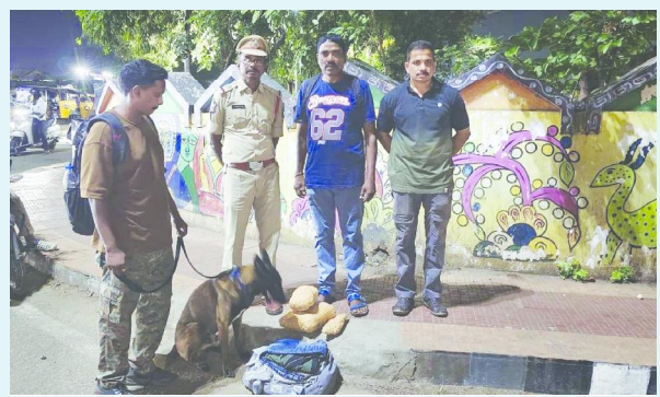
విశాఖపట్నం, సిబిజెన్ టైమ్స్, మే 07

విశాఖ నగర పోలీసుల ప్రత్యేక తనిఖీలో భాగంగా మరొకరి రైల్వే స్టేషన్ వరకు ప్రాంతంలో నార్కోటిక్ డాగ్ సహాయంతో 3.5 కిలోల గంజాయిని పోలీసులు స్వాధీనం చేసుకున్నారు. డా. శంఖుభ్రత బాగ్లికమిషనరీ ఆఫ్ పోలీస్ ఆదేశాల మేరకు, ఆర్బి (సెక్యూరిటీ వింగ్) ఆధ్వర్యంలో డాగ్ స్వామ్ బృందాలు నగరంలోని పలు ప్రాంతాల్లో నిత్య తనిఖీలు నిర్వహిస్తున్నాయి. ఈ క్రమంలో నార్కోటిక్ డాగ్ "విశ్వ" అనుమానాస్పద బ్యాగ్ను గుర్తించగా, తనిఖీ చేయగా అందులో 3.5 కిలోల గంజాయి లభ్యమైంది. నిందితుడు పరాచీలో ఉండటంతో స్వాధీనం చేసుకున్న గంజాయిని తదుపరి విచారణ కోసం ఎయిర్పోర్ట్ పోలీస్ స్టేషన్ కు అప్పగించారు. గంజాయి గుర్తించడంలో కీలక పాత్ర పోషించిన నార్కోటిక్ డాగ్ "విశ్వ", డాగ్ హాండల్లర్ మరియు పోలీసు సిబ్బందిని సీపీ అభినందించారు.