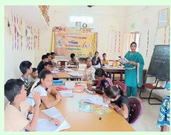
లింగపాలెం (సిటిజన్ టైమ్స్) మే: 07