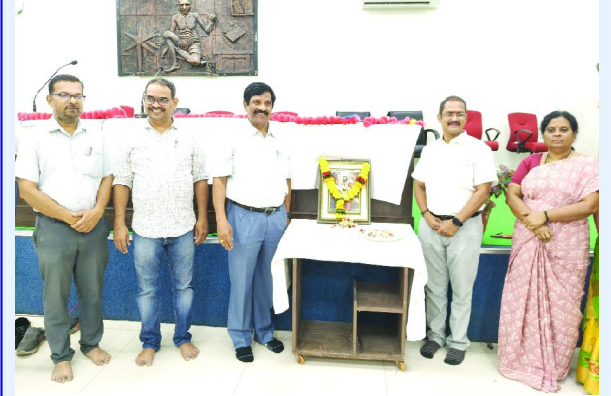
విశాఖపట్నం, సిటిజన్ టైమ్స్, మే :07