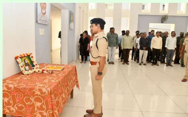
కాకినాడ (సిటిజన్ టైమ్స్) మే 7