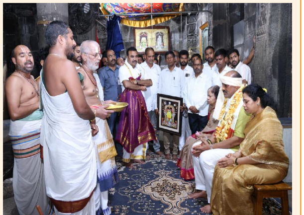
విశాఖపట్నం, సిటిజన్ టైమ్స్, మే :04

సుప్రసిద్ధ పుణ్యక్షేత్రమైన సింహాచలం శ్రీ వరాహ లక్ష్మీ నరసింహ స్వామి దేవస్థానంలో రాష్ట్ర వ్యవసాయ శాఖ మంత్రి కింజరాపు అచ్చెన్నాయుడు దంపతులతో కలిసి సోమవారం స్వామివారిని దర్శించుకుని ప్రత్యేక పూజలు నిర్వహించారు. తమ వివాహ వార్షికోత్సవాన్ని పురస్కరించుకుని ఆలయంలో వేదాశీర్ష్యపనం స్వీకరించారు. ముందుగా ఆలయ అధికారులు మంత్రిదంపతులను పూర్ణకుంభంతో శాస్త్రోక్తంగా స్వాగతించి గర్భాలయానికి తీసుకెళ్లారు. స్వామివారి దర్శనం అనంతరం కప్పనంభం పద్ద సంప్రదాయం ప్రకారం మొక్కులు చెల్లించారు. ఈ సందర్భంగా పలువురు ప్రజాప్రతినిధులు, పార్టీ నాయకులు, కార్యకర్తలు మంత్రిదంపతులకు శుభాకాంక్షలు తెలిపారు. దాదాపు పాతికేళ్ల దాంపత్య జీవితం పరస్పర సహకారంతో ఆదర్శప్రాయంగా సాగుతోందని కొనియాడుతూ వారికి ఆత్మీయ సత్కారం అందించారు. వైశాఖ మాసంలో స్వామివారి దర్శనం ఎంతో ఆనందాన్ని కలిగించిందని మంత్రి అచ్చెన్నాయుడు తెలిపారు. తమకు శుభాకాంక్షలు తెలిపిన అందరికీ ఆయన కృతజ్ఞతలు తెలియజేశారు. కూటమి ప్రభుత్వం ఏర్పడిన తరువాత ఆలయాల అభివృద్ధి, బెంపుల్ టూరిజానికి ప్రత్యేక ప్రాధాన్యం ఇస్తున్నామని చెప్పారు. ఇటీవలి చందనోత్సవం విజయవంతంగా నిర్వహించడం ఇందుకు నిదర్శనమని పేర్కొన్నారు. ఈ కార్యక్రమంలో ఆలయ అధికారులు, ధర్మకులు పాల్గొన్నారు.