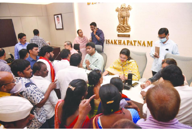
విశాఖపట్నం, సిటిజన్ టైమ్స్, మే :04