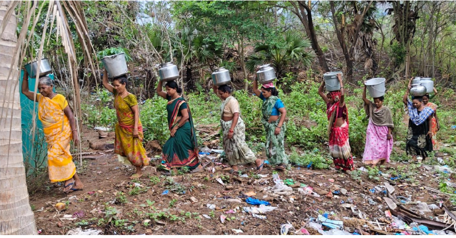
రావికమతం, సిటిజన్ టైమ్స్, మే:04

- తక్షణ చర్యలు తీసుకోవాలి: సిపిఎం డిమాండ్