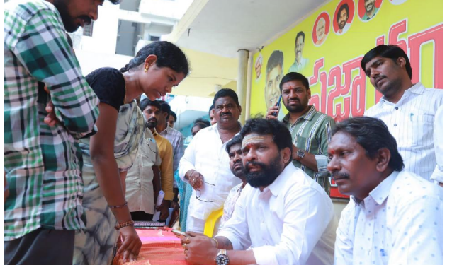
ధ్యేయమని ఆయన పేర్కొన్నారు. ఈ కార్యక్రమంలో కూటమి పార్టీ సీనియర్ నాయకులు వాసంశెట్టి సత్యం, డిడిపీ రాష్ట్ర డిపీ సెల్

రామచంద్రపురం, సిటిజన్ టైమ్స్, మే 04 ప్రజల సమస్యలను తక్షణమే పరిష్కరించేందుకు రాష్ట్ర కార్మిక శాఖ మంత్రి వాసంశెట్టి సుభాష్ సోమవారం ప్రజా దర్బార్ నిర్వహించారు. రామచంద్రపురంలోని మంత్రి క్యాంపు కార్యాలయంలో ఏర్పాటు చేసిన ప్రజా ఫిర్యాదుల విభాగం ద్వారా ఈ కార్యక్రమం జరిగింది. నియోజకవర్గంలోని పలు గ్రామాల నుండి పెద్ద ఎత్తున అర్జీదారులు తరలివచ్చి తమ సమస్యలను మంత్రికి వినిపించారు. మొత్తం 60 అర్జీలు అందగా, వాటిలో పెన్షన్లు మంజూరు చేయాలని, ఇళ్ల స్థలాలు కేటాయించాలని, సిమెంట్ రోడ్లు, డ్రైనేజీ నిర్మాణాలు చేపట్టాలని కోరుతూ వినతులు అందజేశారు. అర్జీలను మంత్రి వాసంశెట్టి సుభాష్ స్వయంగా పరిశీలించి, సంబంధిత అధికారులకు వెంటనే స్పందించి సమస్యలు త్వరితగతిన పరిష్కరించేలా చర్యలు తీసుకోవాలని ఆదేశించారు. ప్రజల సమస్యలు పరిష్కారం కావడం ప్రభుత్వ ప్రధాన