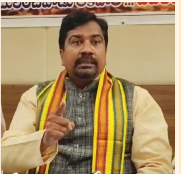
విశాఖపట్నం, సిటిజన్ టైమ్స్, మే :04