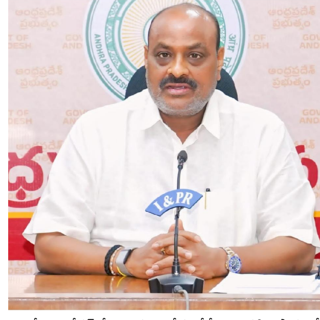
మైక్రో ఇరిగేషన్లో రాష్ట్రం దేశంలోనే మొదటి స్థానంలో నిలిచిందన్నారు. 2014-19లో 6.58 లక్షల హెక్టార్లతో పోలిస్తే, వైసీపీ కాలంలో అమలు తగ్గిపోగా, కూటమి ప్రభుత్వం వచ్చాక వేగవంతం చేసి 2024-26 మధ్య లక్షల హెక్టార్లలో డ్రిప్, స్ప్రింకర్ సదుపాయాల కల్పించామని తెలిపారు. గత ప్రభుత్వం వదిలిన బకాయిల్లో రూ.881 కోట్లు చెల్లించడంతో పాటు, ఉద్యాన పంటల విస్తీర్ణాన్ని పెంచుతూ, +నూను రూ.1.52 లక్షల కోట్లకు చేర్చామని వెల్లడించారు. ముఖ్యమంత్రి నారా చంద్రబాబు నాయుడు విజన్ మేరకు రాయలసీమను గ్లోబల్ హార్టికల్చర్ హబ్గా తీర్చిదిద్దుతున్నామని, ఆయిల్ పామ్ సాగులో రాష్ట్రం దేశంలో అగ్రస్థానంలో ఉందని, కొత్త విస్తరణకు ఛార్జీ ప్రణాళికలు సిద్ధం చేశామని చెప్పారు. కూటమి ప్రభుత్వం రైతు సంక్షేమం, ఆదాయం పెంపు, వ్యవసాయ అభివృద్ధి లక్ష్యంగా పనిచేస్తోందని, వాస్తవాలు తెలుసుకోకుండా అబద్ధాలు ప్రచారం చేసి వైసీపీ నేత మాటలను ప్రజలు తిప్పికొడతారని మంత్రి అచ్చెన్నాయుడు ఘాటుగా హెచ్చరించారు.