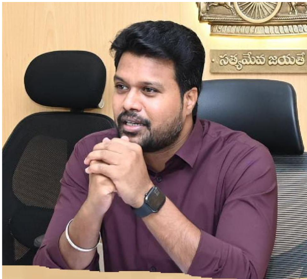
ఆదేశించడం అయినది ఆయన తెలిపారు ఎక్కడా బంకులు ద్రై అవుట్