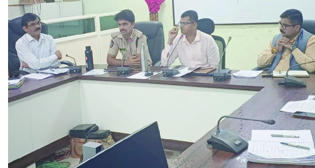
ఏర్పాటుపై సంబంధిత అధికారులకు ఆదేశాలు జారీ చేశారు. అనంతరం కలెక్టర్లతో నిర్వహించిన సమీక్ష సమావేశంలో అన్ని శాఖలు సమన్వయంతో పనిచేసి పర్యటనలో ఎటువంటి లోపాలు లేకుండా చర్యలు తీసుకోవాలని కలెక్టర్ సూచించారు. అరసపల్లి, శ్రీకార్యం ఆలయాల వద్ద భద్రత, పారిశుధ్యం, విద్యుత్ సరఫరా, ట్రాఫిక్ నియంత్రణపై ప్రత్యేక దృష్టి సారించాలని ఆదేశించారు. జిల్లా ఎస్పీ మాట్లాడుతూ భద్రతా ఏర్పాట్లు పక్కన ఉండాలని, కాన్వాయ్ మార్గంలో ఎటువంటి ఆటంకాలు లేకుండా చర్యలు తీసుకోవాలని అధికారులను ఆదేశించారు. ఈ సమావేశంలో వివిధ శాఖల ఉన్నతాధికారులు పాల్గొన్నారు.