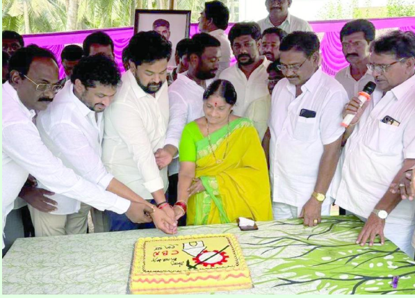
అమలాపురం సిటిజన్ టైమ్స్ ఏప్రిల్ 20

తెలుగుదేశం పార్టీ జాతీయ అధ్యక్షులు, ముఖ్యమంత్రి నారా చంద్రబాబునాయుడు పుట్టినరోజు సందర్భంగా అమలాపురం రూరల్ రోజ్ ఫెస్టివల్ గ్రామంలో నిర్వహించిన పుట్టినరోజు వేడుకల్లో ఎంపీ హరీష్ బాలయోగి పాల్గొన్నారు. ఈ సందర్భంగా గ్రామస్థులు ఏర్పాటు చేసిన కేక్ ను కటింగ్ చేసి శుభాకాంక్షలు తెలియజేశారు.