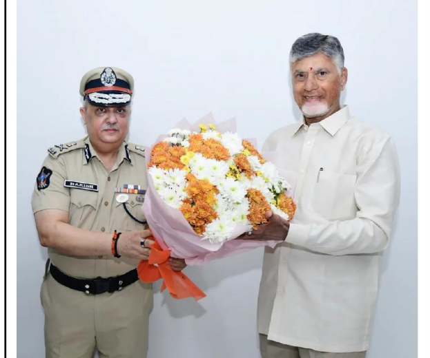
మంగళగిరి, సిటిజన్ టైమ్స్, ఏప్రిల్ 20