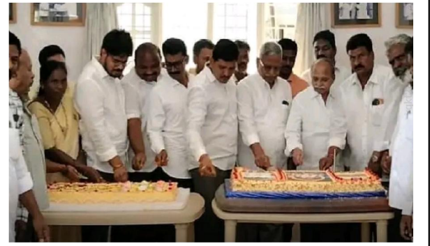
అమలాపురం, సిటిజన్ టైమ్స్ ఏప్రిల్ 20

కలికిరిలోని అమర్నాథ్ రెడ్డి భవన్ నందు కార్యకర్తలతో చంద్రబాబు జన్మదిన వేడుకలు జరుపుకుంటూ పెద్ద కేక్ కట్ చేసి అందరూ ఆనందాన్ని పంచుకున్నారు ఘనంగా పెద్ద కేక్ కట్ చేయడం జరిగింది. ఈ కార్యక్రమంలో మండల తెదేపా నాయకులు, బిజెపి జనసేన నాయకులు కార్యకర్తలను చంద్రబాబు అభిమానులు తదితరులు పాల్గొన్నారు.