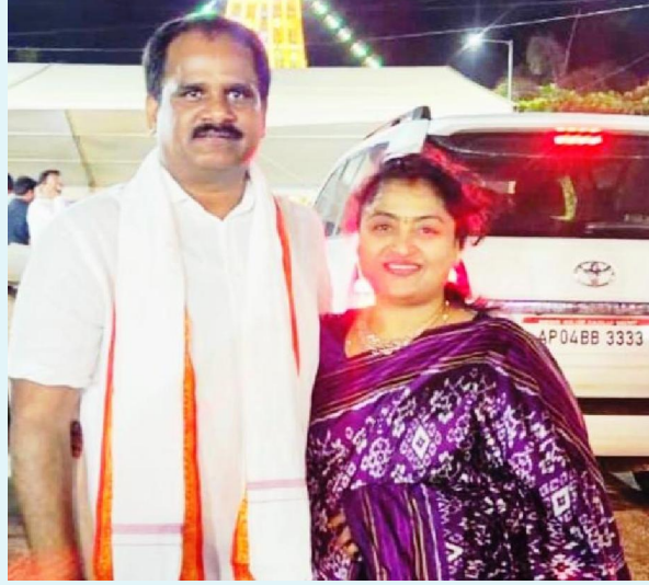
సింహగిరి, సిటిజన్ టైమ్స్, ఏప్రిల్ 20