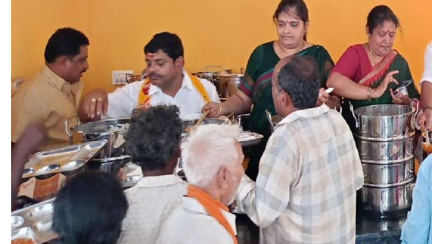
అమలాపురం సిటిజన్ టైమ్స్ ఏప్రిల్ 20