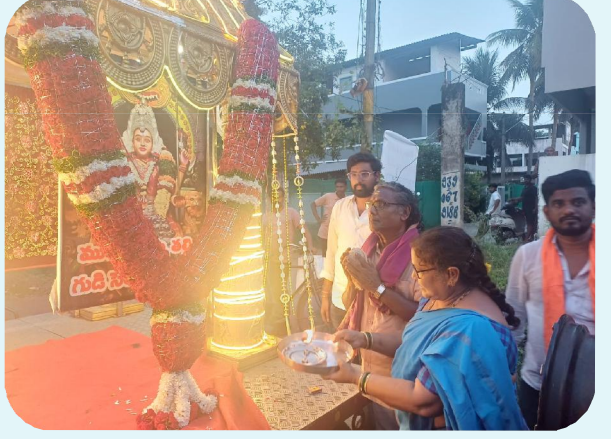
అమలాపురం రూరల్ సిటిజన్ టైమ్స్ ఏప్రిల్ 20