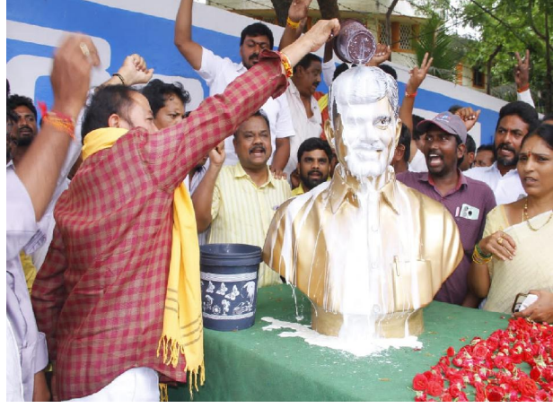
ఏలూరు: ( సిటిజన్ టైమ్స్ ): ఏప్రిల్ 20: