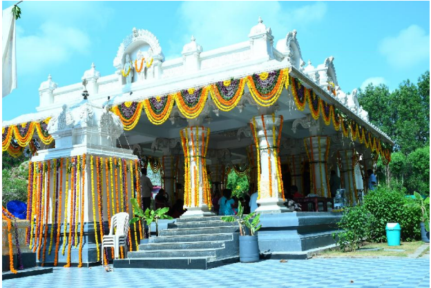
అమలాపురం సిటిజన్ టైమ్స్ ఏప్రిల్ 20

- అందరూ ఆహ్వానితులే - కిమ్స్ చైర్మన్ చైతన్య రాజు