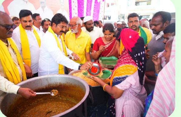
గిద్దలూరు (సిటిజన్ టైమ్స్) ఏప్రిల్ 20