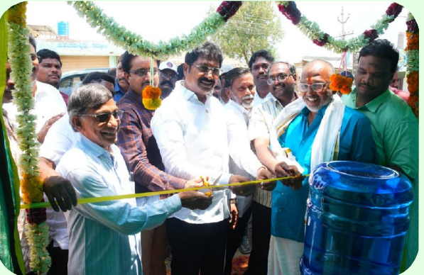
గిద్దలూరు, (సిటిజన్ టైమ్స్) ఏప్రిల్ 20