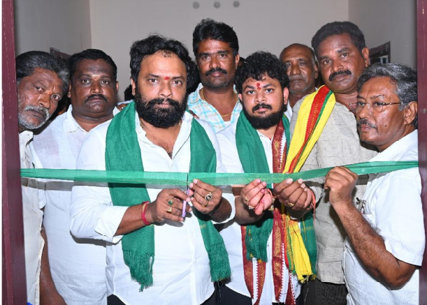
రామచంద్రపురం సిటిజన్ టైమ్స్ ఏప్రిల్ 20

రాష్ట్ర కార్మిక శాఖ మంత్రి వాసంశెట్టి సుభాష్