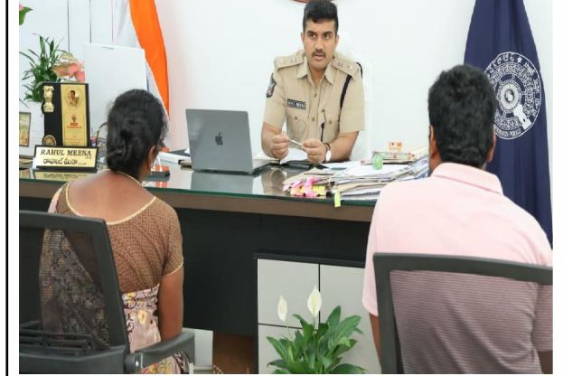
అమలాపురం సిటిజన్ టైమ్స్ ఏప్రిల్ 20