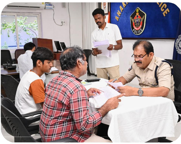
తీసుకున్న చర్యలపై నివేదికను జిల్లా కార్యాలయానికి సమర్పించాలని సూచించారు. ప్రజలకు వేగవంతమైన, పారదర్శక న్యాయం అందించడం పోలీసు శాఖ ప్రధాన బాధ్యత అని, ప్రజా సమస్యల