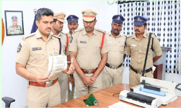
రామచంద్రపురం సిటిజన్ టైమ్స్ ఏప్రిల్ 20