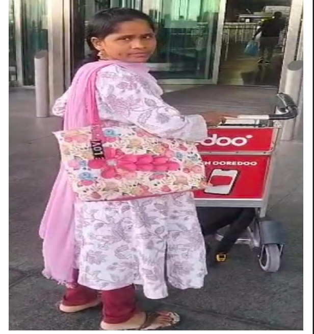
అమలాపురం, సిటిజన్ టైమ్స్ ఏప్రిల్ 20

స్వదేశానికి రప్పించిన కోససీమ వలస దారుల కేంద్రం