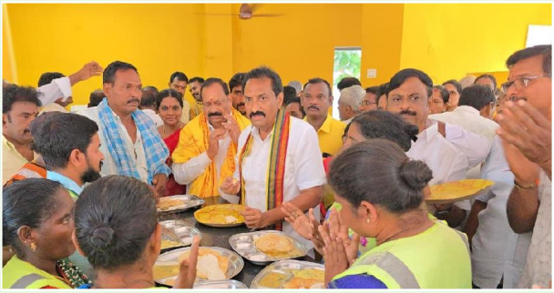
కొత్తపేట సిటిజన్ టైమ్స్ ఏప్రిల్ 20