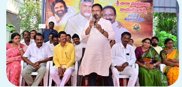
పి గన్నవరం సిటిజన్ టైమ్స్ ఏప్రిల్ 20