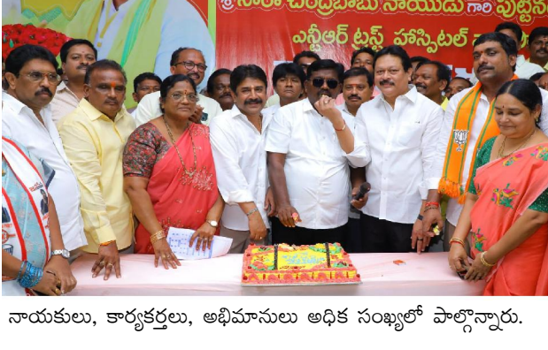
నాయకులు, కార్యకర్తలు, అభిమానులు అధిక సంఖ్యలో పాల్గొన్నారు.